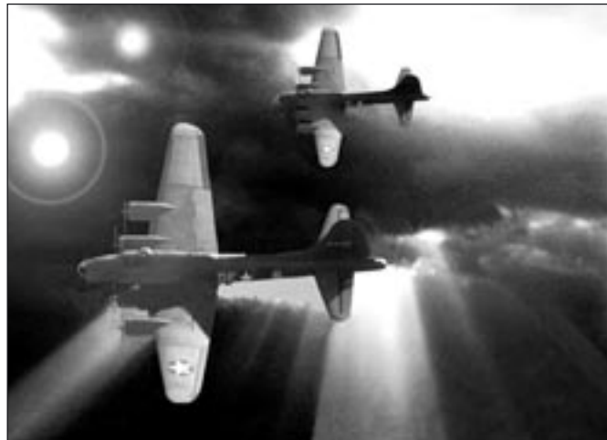
Die Graphik zeigt Foo-Fighter, die einen Verband von B-17-Bombern angreifen.