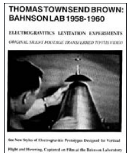
Eine Demonstration des durch Elektrogravitation hervorgerufenen Auftriebs in den Bahnsen Laboratories Ende der 1950er.